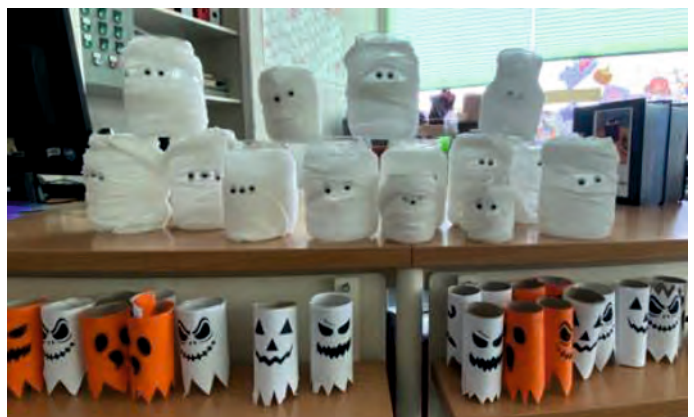
Schaurig-schöne Gruseldeko bastelten die Hortkinder beim Besuch in der Bücherei.

Nachdem während der Vorstellungsrunde ein Spinnennetz gewebt wurde, tauchte die Gruppe ein in die Welt der Geschichte von „Zombert und dem mutigen Angsthasen“. Im Anschluss wurden vielerlei Geister gebastelt und Mumiengläser gewickelt. Der Besuch endete wie es an Halloween der Brauch ist – lieber Süßes geben statt Saures bekommen.