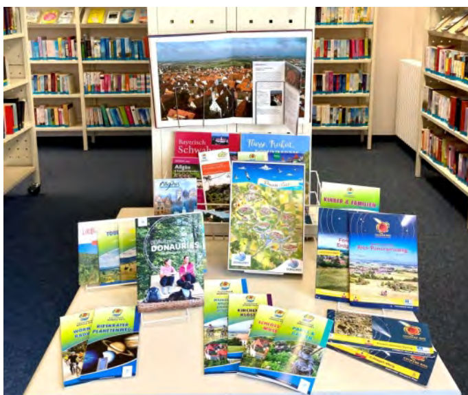
Das neue Landkreis-Puzzle Donau-Ries (Bildmitte) wurde im Wimmelbild-Stil gestaltet. Daneben gibt es Infobroschüren zum Mitnehmen und Reisebücher zum Ausleihen.

Aktuell gibt es in der Bücherei das 100-teilige Landkreis-Puzzle DONAURIES zum Ausleihen. Es ist für Kinder ab sechs Jahren gedacht und wurde im Stil eines Wimmelbildes gestaltet. Dabei wurde versucht, wichtige Sehenswürdigkeiten des Landkreises Donau-Ries in- und außerhalb der sieben Städte grafisch abzubilden. Ziel ist es, dass die Kinder spielerisch entdecken, wo sie Zuhause sind und welche anderen tollen Entdeckungen es im Landkreis gibt.