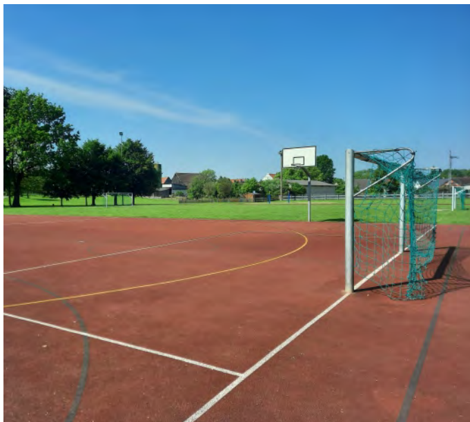
Das Freizeit- und Sportgelände zwischen der Turnhalle und der Grundschule ist bis 16 Uhr nicht für die Öffentlichkeit freigegeben. Das Betreten des Geländes ist bis zu diesem Zeitpunkt untersagt.

Ab 16 Uhr darf das Freizeit- und Sportgelände für alle Personen öffentlich genutzt werden. Wir bitten hier dringend um Einhaltung dieser Vorgabe. Es ist wünschenswert, wenn Eltern dies mit ihren Kindern und Jugendlichen kommunizieren.