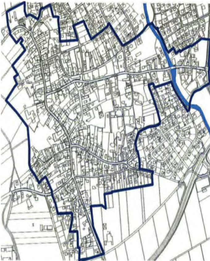
Das betreffende Gebiet für die Förderung von Sanierungsmaßnahmen umfasst im Wesentlichen den Altort.