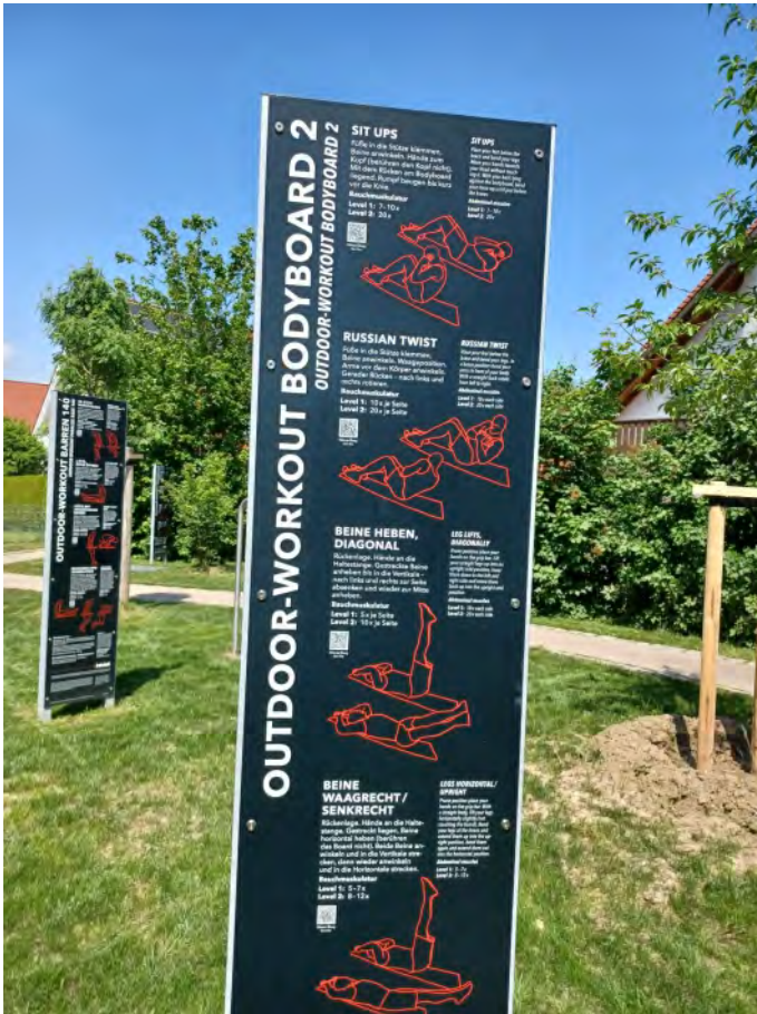
An mehreren Stationen können gezielt Fitnessübungen praktiziert werden – unter freiem Himmel und kostenlos. Probieren Sie es gleich mal aus!