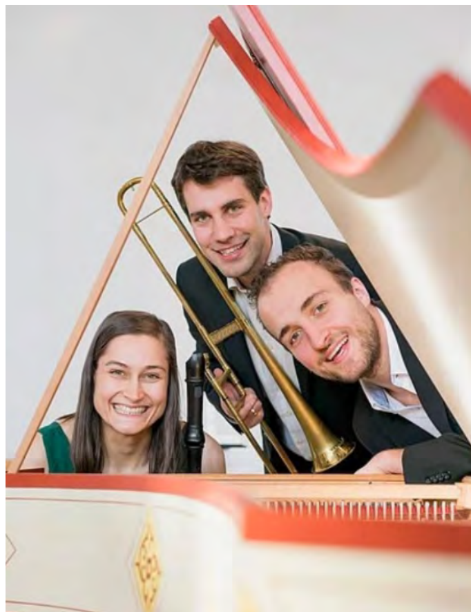
Das Trio ERA kommt zum Kirchenkonzert nach Druisheim.