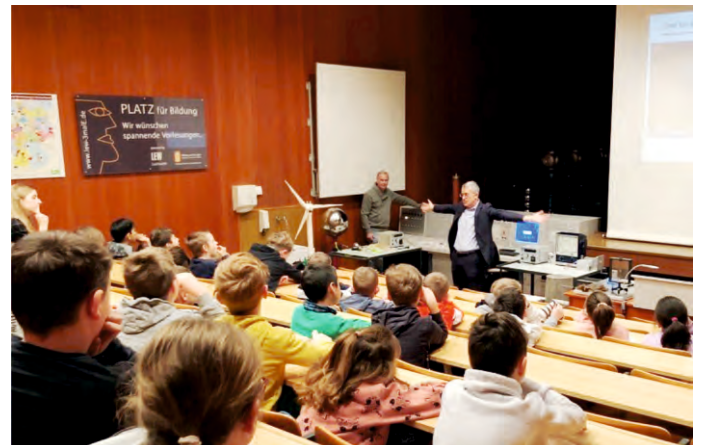
Die Drittklässler waren zu Besuch bei der LEW-Kinderuni an der Hochschule Augsburg.