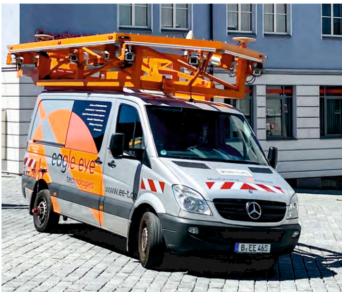
Ein Messfahrzeug der Fa. eagle eye technologies befährt im Auftrag der Gemeinde das öffentliche Verkehrsnetz.

Der Internet-Konzern Google hat vor einiger Zeit begonnen, auch in Deutschland u.a. Straßen für den Online-Kartendienst Google Street View zu filmen. Viele Datenschützer, Politiker und betroffene Bürger sehen durch diese Aktivitäten wichtige Persönlichkeitsrechte gefährdet. Angesichts des mit Kameras ausgestatteten Erfassungsfahrzeugs der eagle eye technologies sind manche Bürger daher verständlicherweise irritiert. Ergo: Die Erfassung von Verkehrsinfrastrukturdaten durch eagle eye ist in keinster Weise mit den Aufnahmen von Google Street View zu vergleichen.