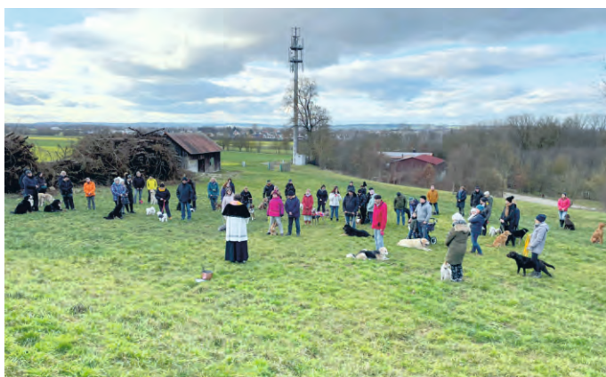
Pfarrer Markus Lidel segnete ca. 40 Hunde. Die dabei erzielten Spenden wurden vollumfänglich durch Alfred Polzer an das Tierheim Hamlar überreicht.

Die Tiersegnung hatte zudem einen guten Zweck: Die im Vorfeld erbetenen Spenden ergaben eine stolze Spendensumme in Höhe von 450,- €, die Alfred Polzer am 12. Februar dem Tierheim in Hamlar übergeben hat. Die Leiterin des Tierheims bedankte sich herzlich und betonte, dass jede Hilfe dringend benötigt wird. Der Dank geht an alle Tierliebhaber, die zur Spendensumme beigetragen haben.