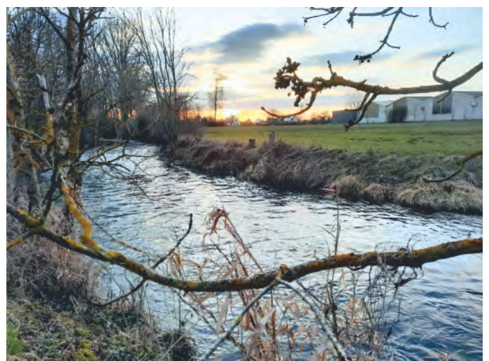
„Panta rhei“ – mit diesem Zitat aus der Antike wünschen wir allen unseren Leserinnen und Lesern einen wunderschönen Frühling – möge der unaufhörliche Fluss des Lebens friedlich weiterströmen.

Das vollständige Gedicht Goethes können Sie gerne im Internet nachlesen, es sei Ihnen herzlichst empfohlen.