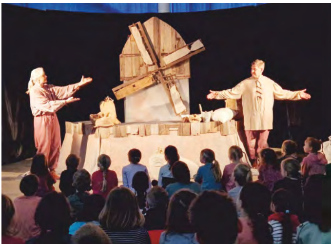
Es sind einzigartige Inszenierungen: Das Moussong Theater entführt seine Zuschauer mit fantastischen Bühnenbildern in eine faszinierende Welt – originell, humorvoll, tief sinnig und mit jeder Menge Sprachwitz!

Weitere Informationen unter: https://www.moussong.de/