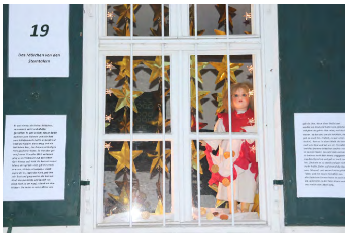
Die Museumsfreunde Mertingen beteiligten sich an der Aktion „Mertinger Adventsfenster 2022“.