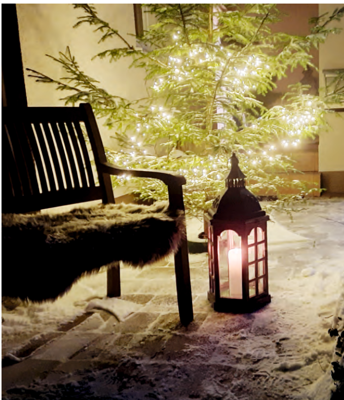
Gönnen Sie sich Ruhepausen, schützen Sie Ihre Ressourcen und kommen Sie so gut gerüstet durch das neue Jahr.