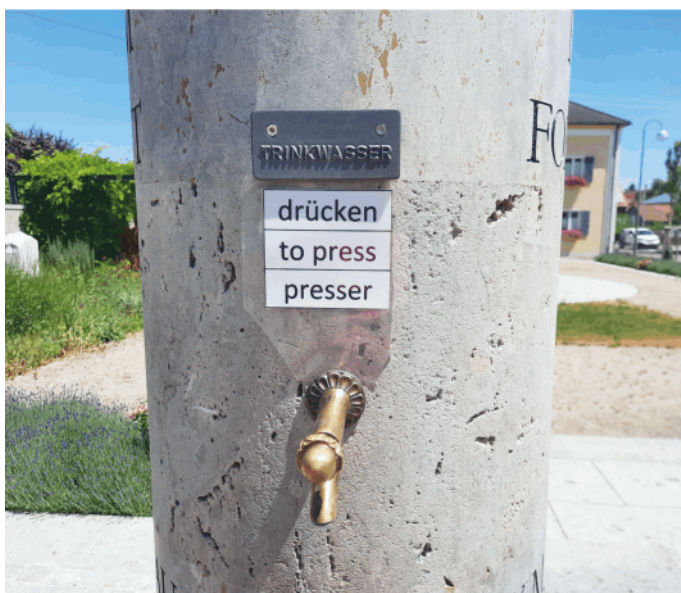
Gerade bei den derzeit heißen Sommertemperaturen bietet die „Trinkwasserstation“ am Römerplatz eine willkommene Erfrischung. Im Übrigen ein Luxus, wenn man bedenkt, wie viele Regionen auf der Erde es gibt, in denen Menschen kilometerweit bis zur nächsten Wasserstation laufen müssen.

Bürgerinnen und Bürger können am Mittwoch, den 12.07.23 von 16.00 – 17.30 Uhr unserem Bürgermeister Veit Meggle ihre Anliegen mitteilen. Es muss kein Termin vereinbart werden.