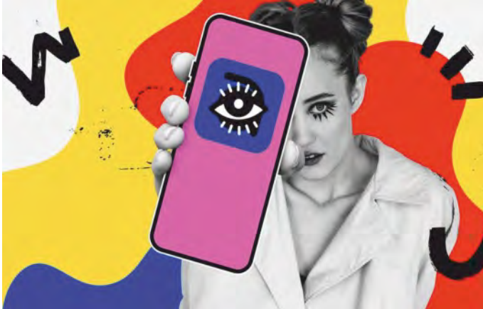
Augen auf: Mit der KulturPass-App Kultur entdecken

Zwei Jahre lang konnten junge Menschen während der Pandemie keine Live-Kultur erleben. Mit dem KulturPass möchte der Bund es ihnen jetzt leichter machen, ihre Kulturszene vor Ort näher kennenzulernen. Dazu ist nun die KulturPass-App gestartet. Alle jungen Menschen, die in Deutschland leben und in diesem Jahr ihren 18. Geburtstag feiern, können mit einem virtuellen Budget von 200 Euro auf kulturelle Entdeckungstour gehen. Die App steht in den Stores zum Download bereit. Weitere Infos unter www.kulturpass.de/jugendliche