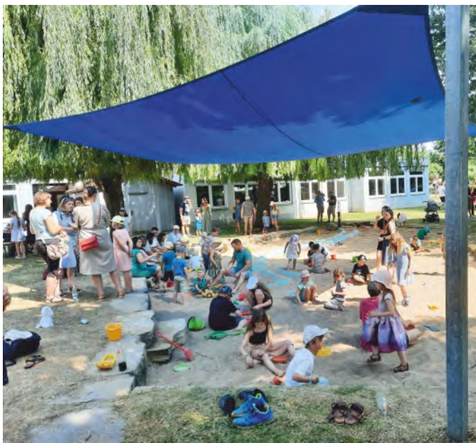
Impressionen aus dem Kita-Garten: Emsig suchten die Kinder nach den begehrten Gold- und Silbersteinen im großen Sandkasten und siebten um die Wette, während die Erwachsenen die Gelegenheiten zu angenehmen Gesprächen nutzten.

Ein weiterer Dank richtet sich an dieser Stelle an all die fleißigen Kuchen- und Tortenbäcker aus der Bürgerschaft sowie an die Helfer am Kuchen- und Getränkestand.